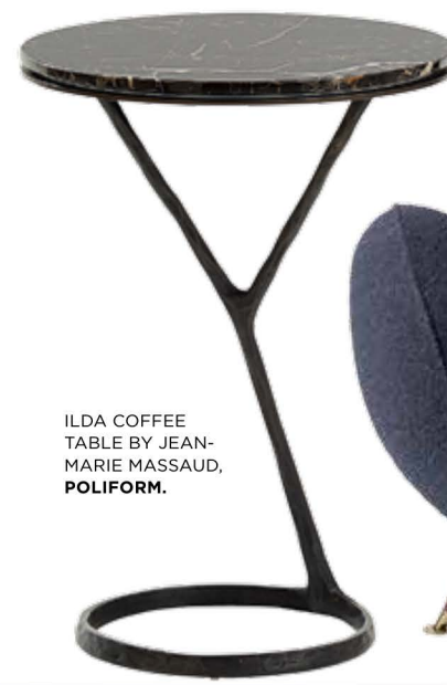
ILDA COFFEE TABLE BY JEAN-MARIE MASSAUD, POLIFORM.