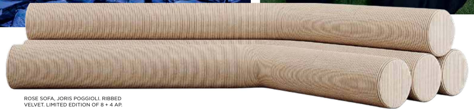
ROSE SOFA, JORIS POGGIOLI. RIBBED VELVET. LIMITED EDITION OF 8 + 4 AP.