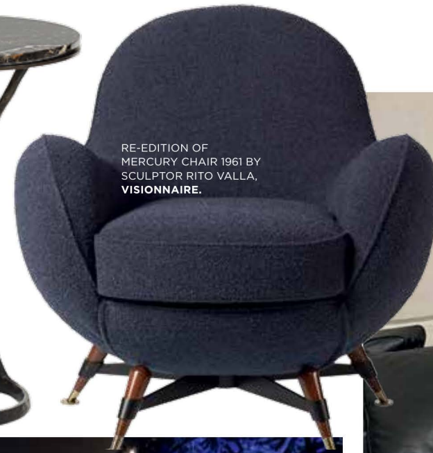
RE-EDITION OF MERCURY CHAIR 1961 BY SCULPTOR RITO VALLA, VISIONNAIRE.