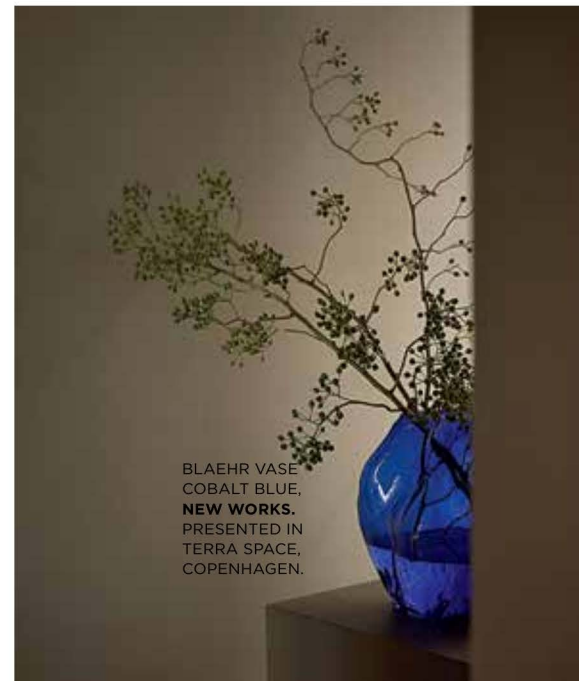
BLAEHR VASE COBALT BLUE, NEW WORKS. PRESENTED IN TERRA SPACE, COPENHAGEN.