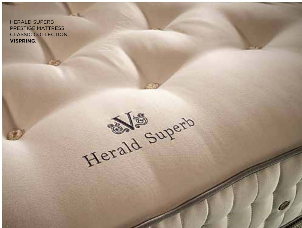
HERALD SUPERB PRESTIGE MATTRESS, CLASSIC COLLECTION, VISPRING.