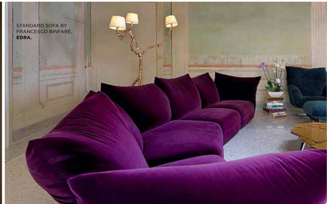
STANDARD SOFA BY FRANCESCO BINFARÉ, EDRA.