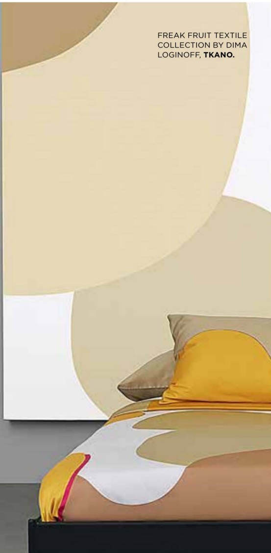
FREAK FRUIT TEXTILE COLLECTION BY DIMA LOGINOFF, TKANO.

И скусство ничего не делать стало одной из самых эффективных концепций медленной жизни во времена «глобального сдерживания». У голландцев есть для этого отдельное слово — niksen , обозначающее творческое созерцание и раскованное безделье. Этот тренд оказался ответом на выгорание и культ гиперактивности, поддерживаемые в последние годы. То, что вчера считалось ленью, сегодня называется бездействием и считается источником творческих способностей. Тренд превозносит все, связанное с ростом практик медитации, появлением комнат для сна, новыми брендами домашней одежды и бизнеса сна в целом. Сознательное замедление, которое отражает дух времени, больше всего стремится к форме минимализма. Герой, живущий в стиле «никсен» уверен, что лучше оставаться дома, чем выходить на улицу, — спокойный же интерьер символизирует право души отключиться и поощряет к замедлению.