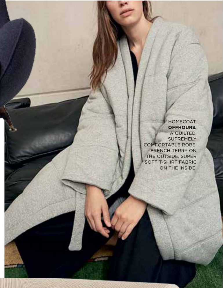
HOME COAT, OFFHOURS. A QUILTED, SUPREMELY COMFORTABLE ROBE. FRENCH TERRY ON THE OUTSIDE, SUPER SOFT T-SHIRT FABRIC ON THE INSIDE.